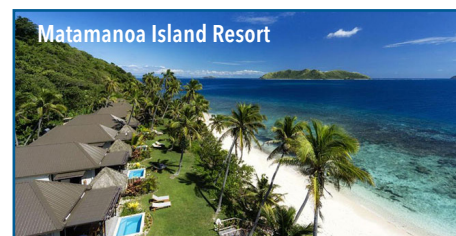
Matamanoa Island Resort

Partenze giornaliere da Milano, Venezia, Roma e Napoli con voli Emirates/Qantas, da Catania e Napoli con voli flydubai Sistemazione in camera doppia in solo pernottamento in Australia, a Nadi e Denarau, con prima colazione a Matamanoa